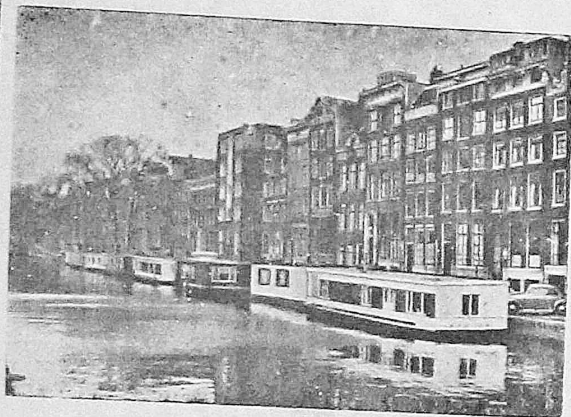
Голландия. Амстердам. Жилые плавучие дома на канале.