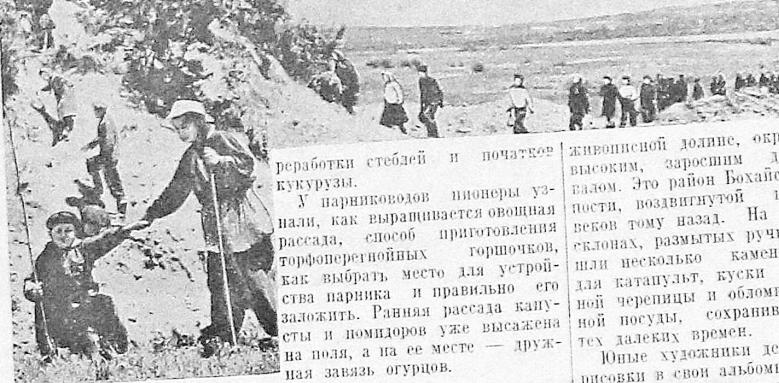
...Майка крыльями машет. За собой нас зовут...

Песня летит над широкой гладью реки и, отражаясь от крутых прибрежных скал, эхом возвращается к парому. Вот и причал. Один за другим участники пионерского похода сходят по трапу на берег и, построившись в колонну, направляются к конечному этапу своего пути — в совхоз № 4. Еще несколько минут и, обогнув крутой склон горы, ребята подошли к поселку.